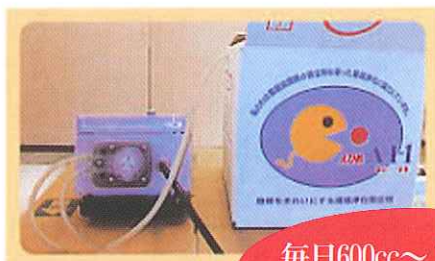
自動注入装置(本体)

グリストラップの油をすばやく吸着し、槽内の油分除去・ダマ防止に効力を発揮します！